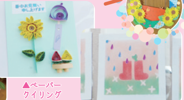
▲ペーパークイリング