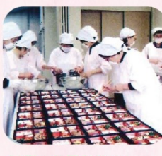
毎週50個前後のお弁当を作ってきました。調理中

長年にわたり地域の高齢者世帯などに手作りのお弁当を届け、見守りを続けてこられた『かしわ会』が、5月末をもって活動を終了されました。今回は、これまでの活動の様子を地域の皆さまにご紹介させていただきます。『かしわ会』さんは平成11年に中屋敷地域ケアプラザの開設と同時に瀬谷北部地区、本郷地区のボランティアさんを中心にスタートされました。高齢者の一人暮らし、高齢者世帯、体の不自由な方等、調理の困難な人を対象に週一度昼食を届けていると同時に、少しでも高齢者にとって明るく住みよい地域にするためにも安全確認見守りの活動を積み重ねてこられました。