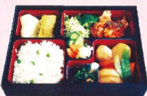
地域の方たちの手作り弁当は、美味しくてボリュームたっぷり！