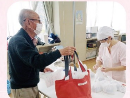
台風や雪の日も配達と見守り、みんなで手分けをしてお弁当を届けました。