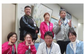
今年もよろしく お願いします！