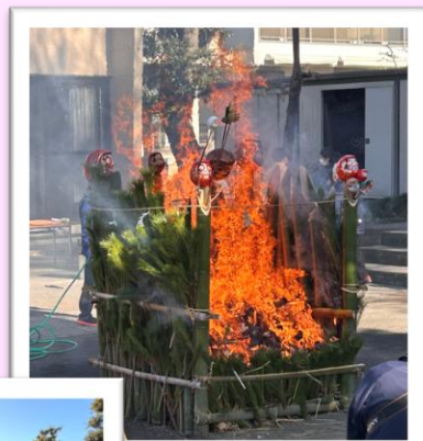
どんど焼き (本郷神明社)