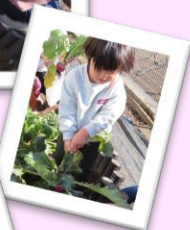
子育てサークル「すくすく」カブ掘り