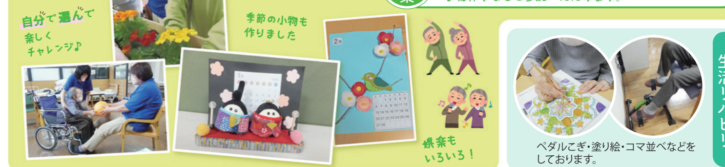
自分で選んで 楽しく チャレンジ♪