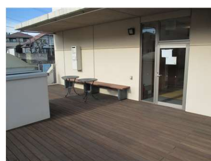
1月に塗装してキレイになりました